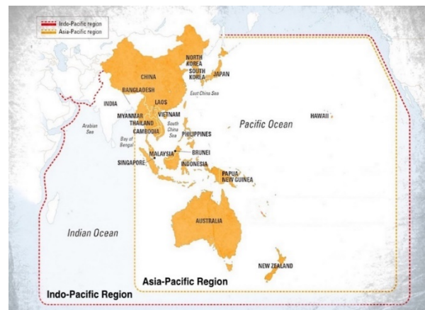
Gambar 1. Peta Indo-Pasifik

Free and Open Indo Pacific (FOIP) atau Indo Pasifik yang terbuka merupakan sebuah gagasan strategi yang dibangun oleh AS dan sekutunya yang berada di kawasan Indo-Pasifik. Gagasan ini berarti sebagai sebuah komitmen bagi Amerika Serikat dalam menciptakan kawasan Indo Pasifik yang terbuka, terhubung, sejahtera, makmur, dan kuat.